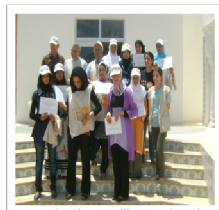
Formation des travailleurs sociaux de l'ATSR

L'UNFPA a suivi de près les activités mises en place par l'ATSR, et ce aussi bien par les coordinateurs déployés au sud que par les équipes du bureau de Tunis et du Caire.