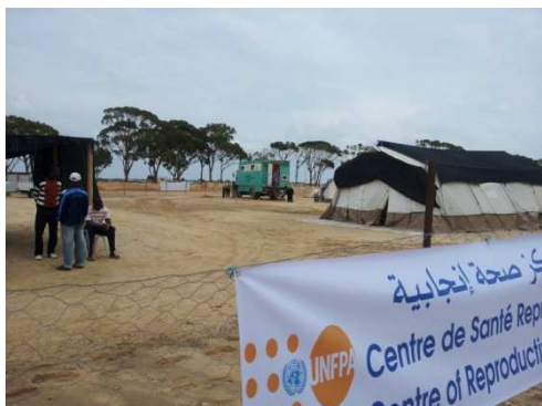
Clinique mobile de SR en partenariat avec l'ONFP

Par ailleurs, et avec l'appui du bureau régional de l'UNFPA des Etats arabes, environ 25 éducateurs pairs, réfugiés âgés de 14 à 26 ans ont été formés sur la SR et la violence fondée sur le genre, ces éducateurs pairs ont, par la suite, contribué à la sensibilisation et l'orientation de leurs pairs et communauté aux services de SR/VFG fournis dans le camp.