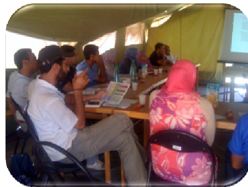
Séance de formation sur la prise en charge médicale du viol

A coté des prestations de service de SR y compris la composante VFG, l'UNFPA a mené plusieurs autres activités telles que la réalisation, en collaboration avec les autres partenaires, d'un audit de sécurité dans le camp de Choucha qui vise la réduction des risques de VFG dans le camp. 23 focus group ont été conduits auprès de 248 résidents afin d'identifier les facteurs de risque à la VFG et ont résulté sur des recommandations qui amélioreront les conditions de vie dans le camp notamment pour les femmes et les filles et leur éviteront l'exposition à la violence.