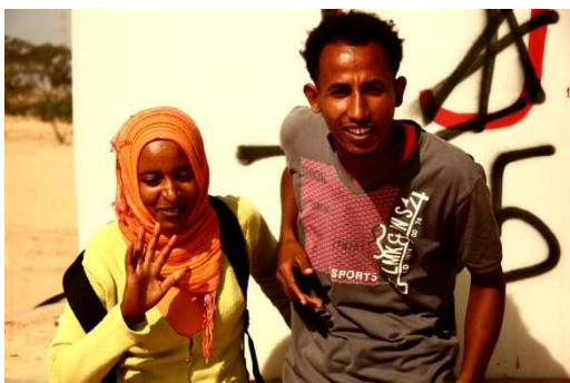
Photo prise par une jeune pour l'exposition

Par ailleurs, un atelier de photographie a ciblé 12 jeunes du camp (6 filles et 6 garçons) afin qu'ils apprennent les bases de la photographie et prennent eux mêmes des photos traçant le vécu des femmes et des filles dans les camps afin de leur rendre hommage pour leurs efforts quotidiens contribuant au bien être de leur famille. Les photos ont été exposées à Tunis, la capitale lors de la Journée des Nations Unies, et dans le camp. L'activité a été très appréciée par les jeunes et la communauté.