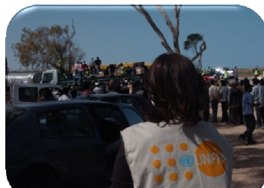
Mobilisation de l'UNFPA au début de la crise

la composante violence fondée sur le genre.