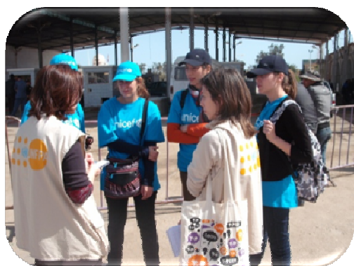
Coordination avec UNICEF

L'UNFPA a, ainsi, assuré le leadership du sous groupe Violence fondée sur le genre au sein du groupe Protection et a également été présent dans les réunions de coordination du groupe santé placé sous le leadership de l'OMS, pour partager les informations relatives à la santé de la reproduction. Ces réunions de coordination avec les agences et institutions œuvrant sur le terrain ont permis un partage approprié de l'information et des prises de