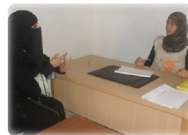
Entretien psychologique avec une libyenne