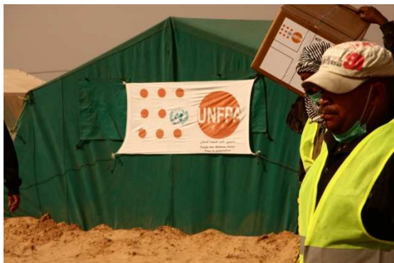
Tente UNFPA pour la SR et distribution des Kits

C'est ainsi, que l'UNFPA a fourni des Kits de santé de la reproduction 1 aux centres médicaux de la région/ hôpital militaire Tunisien, Hôpital Militaire Marocain, Hôpital de Ben Guerdane etc... Le bureau a également distribué des kits d'hygiène et des kits pour bébés pour les familles réfugiées.