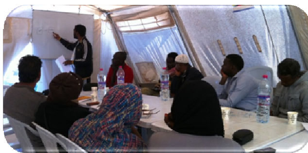
Table ronde avec les leaders communautaires

Dans le même effort de plaidoyer d'amélioration des conditions de sécurité dans le camp, l'UNFPA a pris le leadership dans les 16 jours d'activisme contre la VFG dans le camp. Sous le titre « Apporter la paix au sein du foyer », L'UNFPA a initié des activités de sensibilisation par l'organisation de tables rondes avec les leaders communautaires afin de prévenir et de répondre à la VFG. Les discussions avec les leaders ont été très fructueuses et ont permis d'identifier un système de référence interne pour les cas de violence.